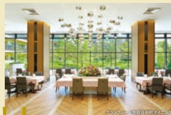
グランクレール世田谷中町ダイニング